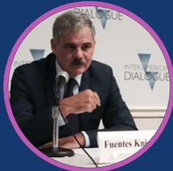
Dr. Juan Alberto Fuentes Knight

Abogada y Notaria, Magister en Derechos Humanos, Magister en Derecho Constitucional, con Postgrado en Teoría de Género y Derechos de las Mujeres